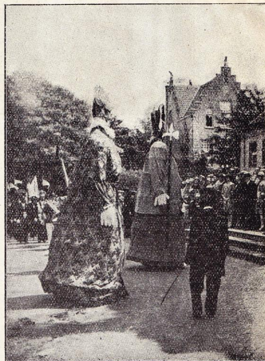
Les géants se mettent à danser.

passé. Avec ses anciennes coutumes, elle a conservé ses vieilles corporations, gildes séculaires qui, ailleurs, furent bannies des villes, mais qui, ici, survivent dans le calme des villages et des campagnes où elles perpétuent leurs fières traditions. Les antiques gildes d'arbalétriers, par